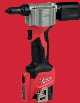
Modèle présenté M12 BPRT-201X